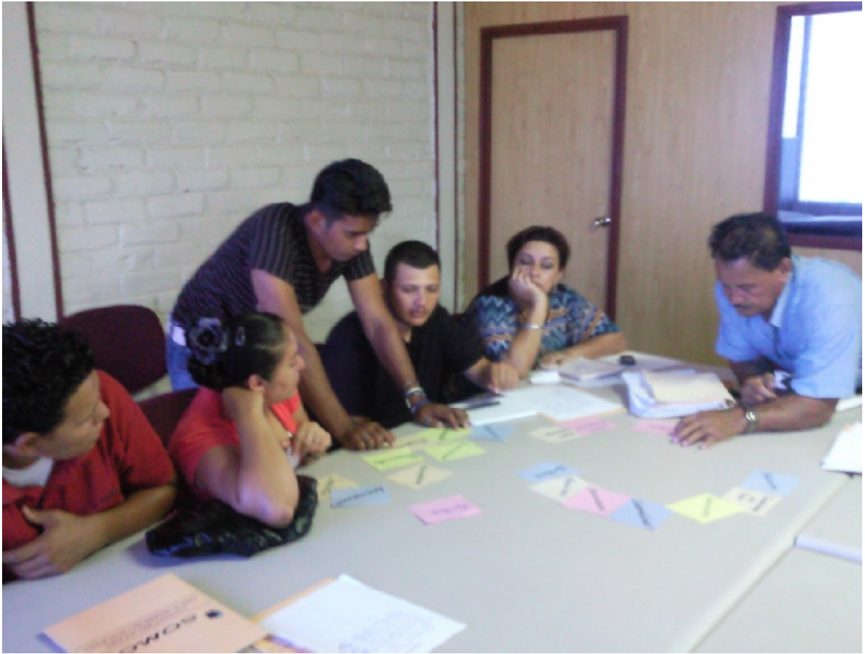
CAPACITACIÓN DEL GRUPO GESTOR