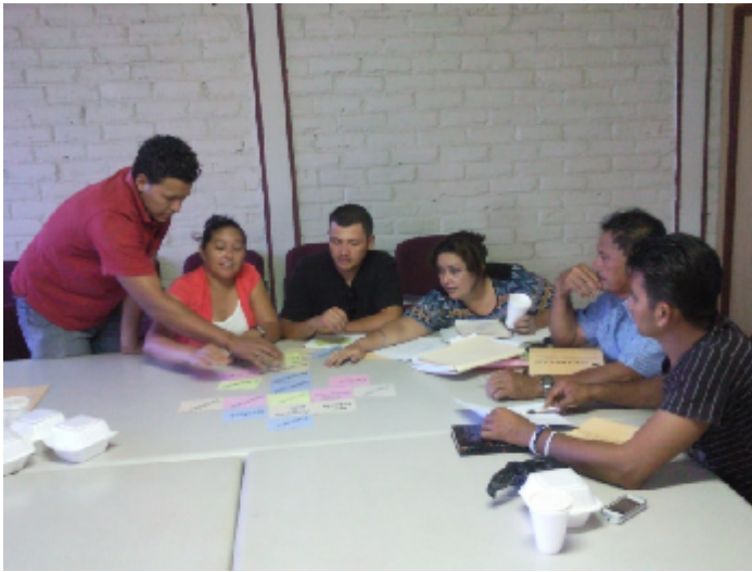
ELABORACION DE VISION Y MISION