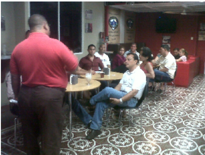
COMERCIANTES Y PESCADORES