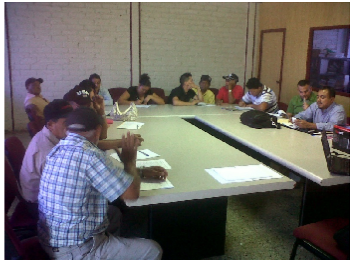
CAPACITACIÓN DEL GRUPO GESTOR